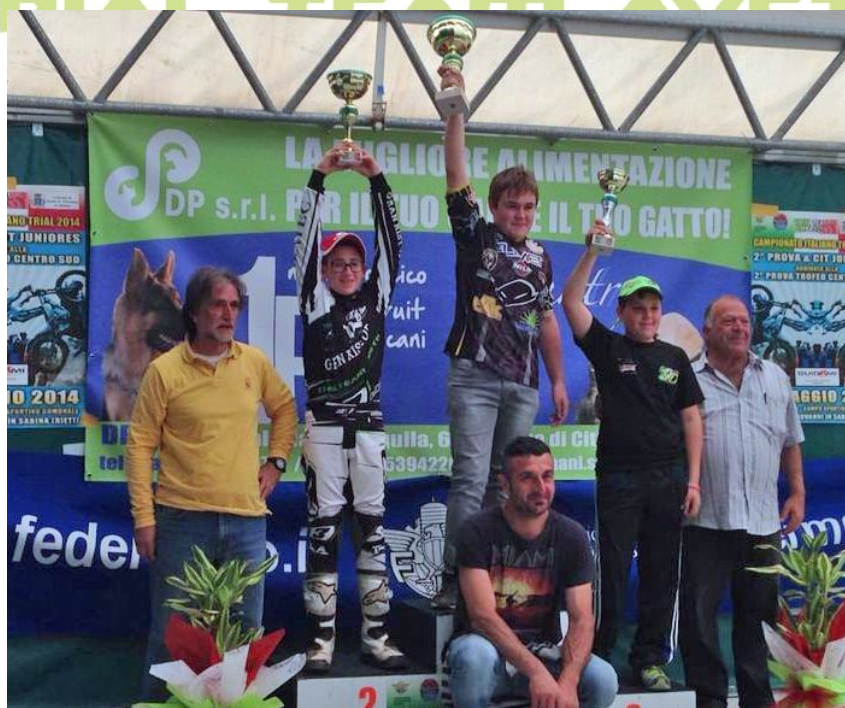
Podio Juniores C

Prossimo impegno per i piloti del TTA davanti al pubblico di casa, con la seconda prova del Campionato Regionale Ligure in programma domenica 25 maggio a Santo Stefano D'Aveto.